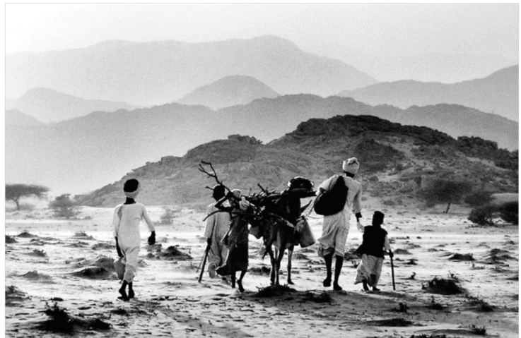
Êxodos. Sebastião Salgado.